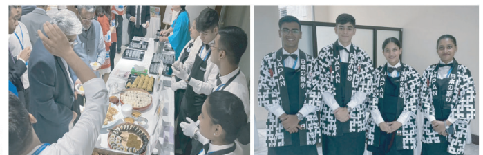
インドの料理学生が日本のおもてなしを元に料理を提供しながら

日本大使館内で出展された企業も商品を陳列しながら来場するお客様へ商品試供などを実施。積極的に会話を通し、商品が何なのかを伝える。日本の加工食品の味や品質についてはインドでも定評があるとの事から不安なく試食ができると話す来場者もいました。試食についてはベジタリアンもいるので事前説明は必須ですがそれでも試食して美味しいを伝えていただける事の嬉しさを異国の地で感じた事業者さんが多く本イベントの延長線上に日本の食品流通があるという確信を得ました。