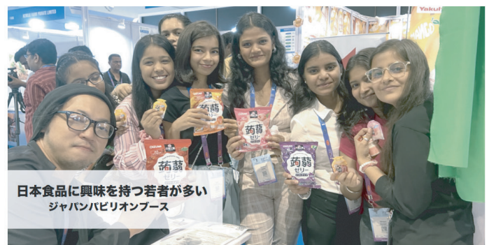
各社様よりお預かりした商品も共同ブースにて PR

こんにゃくゼリー、干し芋、ラムネなど、その場で試食が可能な物は試食提供をしながら反響を含め意見を集約。甘い物が大好きなインドの若い人にも日本の商品は受け入れられる傾向が、特に若い女性は健康意識も強くあり、日本の食品に対する安全性はもちろん、品質の高さなども含め関心が高い。干し芋も添加物が入らないナチュラルな点が非常に良いとの声も多くあり、可能性を感じます。