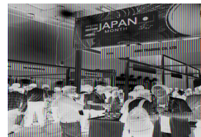
12平米の1コマイメージ 基本設備は下記参照

■ 1 コマ /12 平米 (間口 4m、奥行き 3m) 450,000 円 (18%) (設備 1 セット) 3,000 ドル (インド税込) / 別紙の基礎ブース標準設備