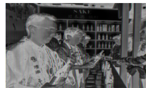
36平米(別途内装他)を含めた カスタムメイドブースのイメージ

■ 36 平米から (12平米単位で追加が可能) ※寸法はご相談。 平米単価: 27,000 円 972,000 円 ~ (18%) 平米単価: 180 ドル 6,480 ドル ~ (インド税込)